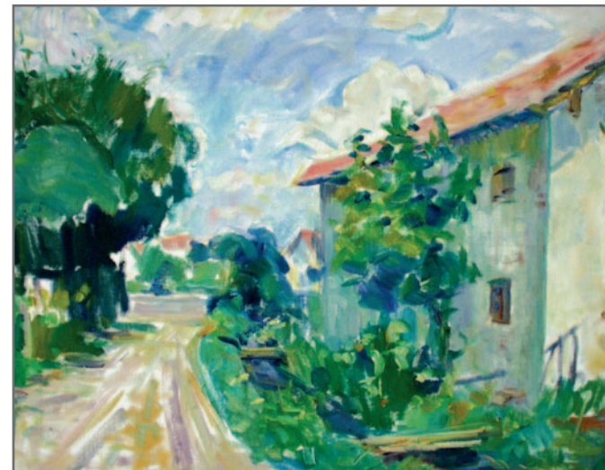
Das Malura Museum vor der Renovierung.